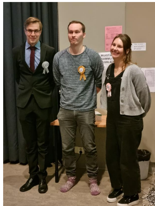
Muikkeit vuoden opettajina palkitut.